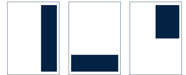
1/3 Seite hoch 1/4 Seite quer 1/4 Seite hoch